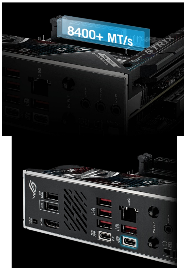
ASUS ROG STRIX B850-I GAMING WIFI

Kombinace WiFi 7 a Intel 2,5Gigabit LAN zajistí rychlost a spolehlivé připojení pro on-line gaming nebo činnost s on-line nástroji na rozmanitých projektech. Porty USB umožňují rychlý přenos dat a podporu nejnovějších periférií. Díky pokročilému DIY designu deska usnadňuje montáž a celkovou správu a stavitelům PC při skládání neudělá těžkou hlavu.