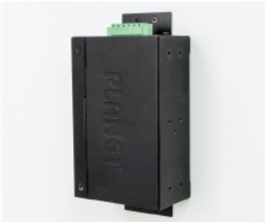
Side Wall Mounting (Space saving)